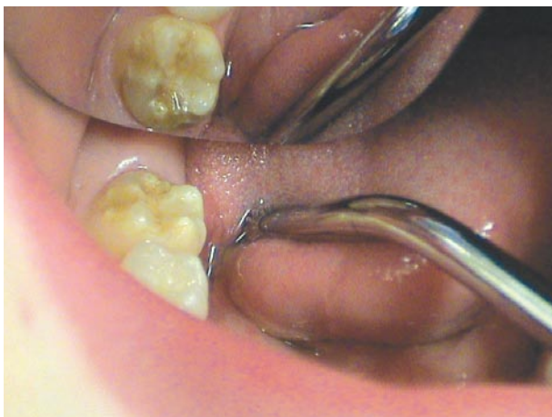
En misfarvet 6-års tand