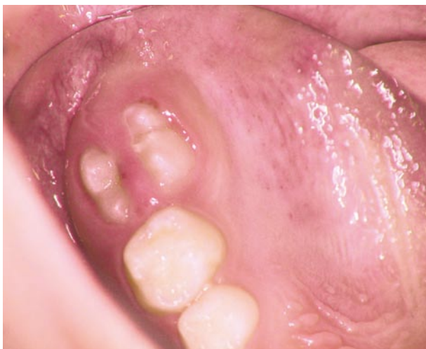
En 6-års tand er på vej frem

Oftte opdager man slet ikke, at de nye tænder er på vej, fordi de ikke skubber nogen mælketænder ud. Man taber altså ikke nogen mælketænder, der hvor 6-års tænderne kommer.