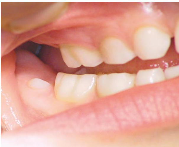
En 6-års tand er på vej frem

6-års tænderne vokser frem bag mælkekindtænderne og kan være svære at få øje på.