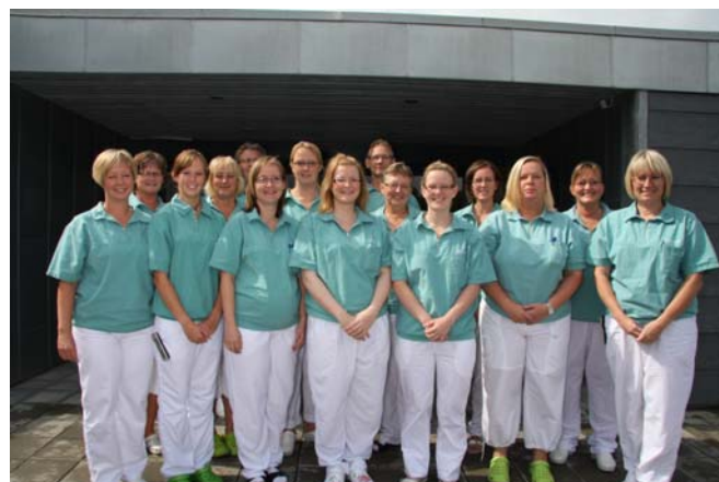
Personalet på Vildbjerg Tandcenter