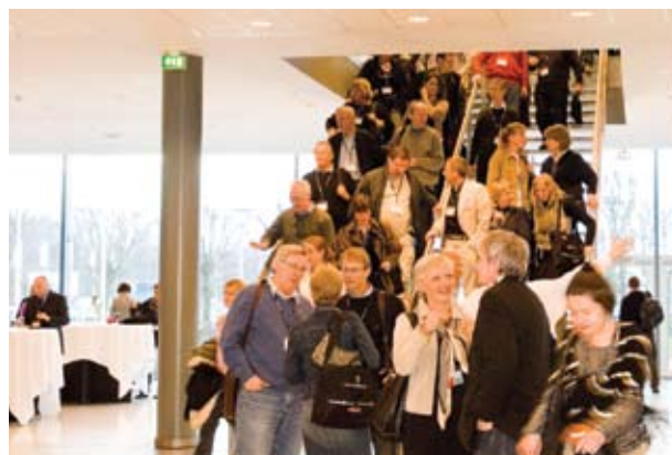
Kursusdeltagere på vej fra den officielle åbning til get-together