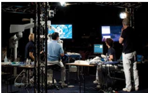
En Livesession ...