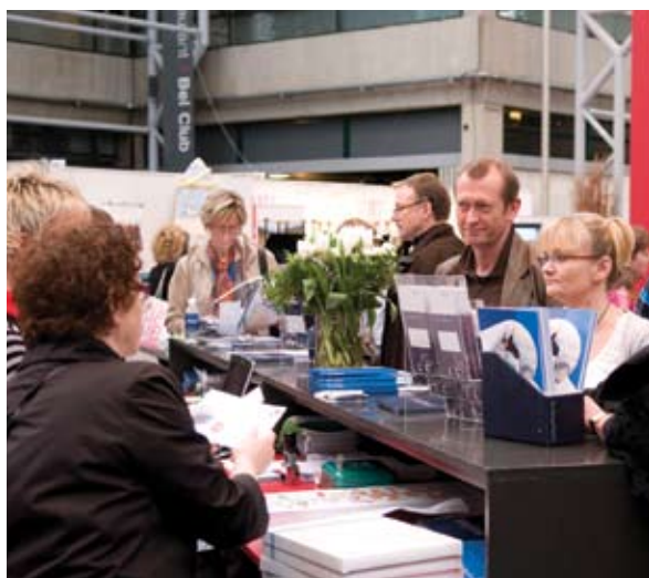
Glimt fra Centerhallen ...

Kom også og hør nærmere om fx foreningens kursusrejse til FDI i Brasilien.