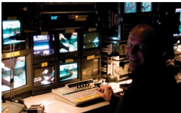
– og kræver en stor teknisk opbygning