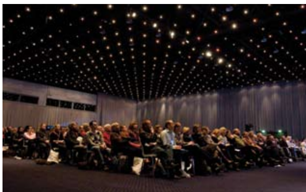
– trækker fuldt hus ...